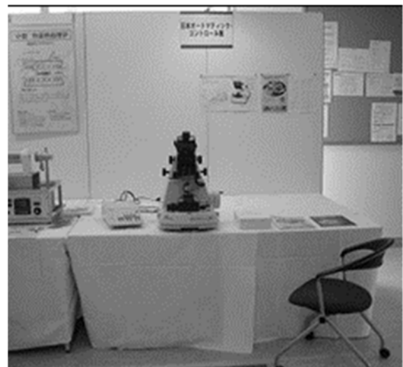
(b) ブースレイアウトの例